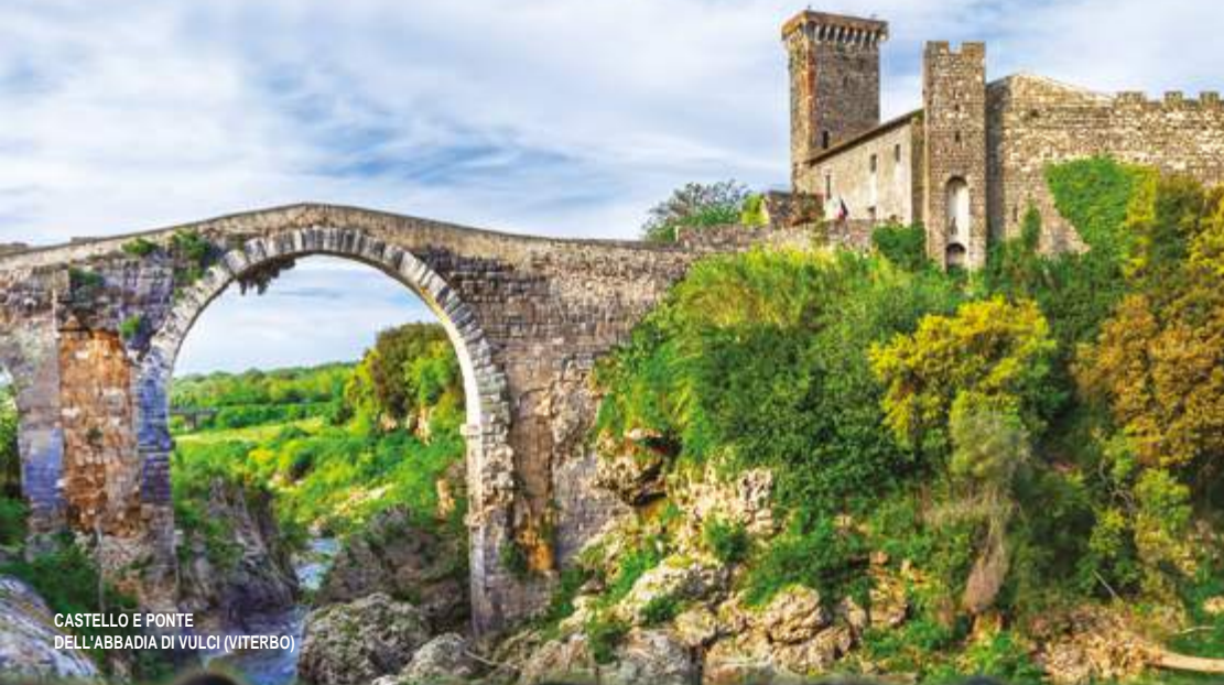
CASTELLO E PONTE DELL'ABBADIA DI VULCI (VITERBO)